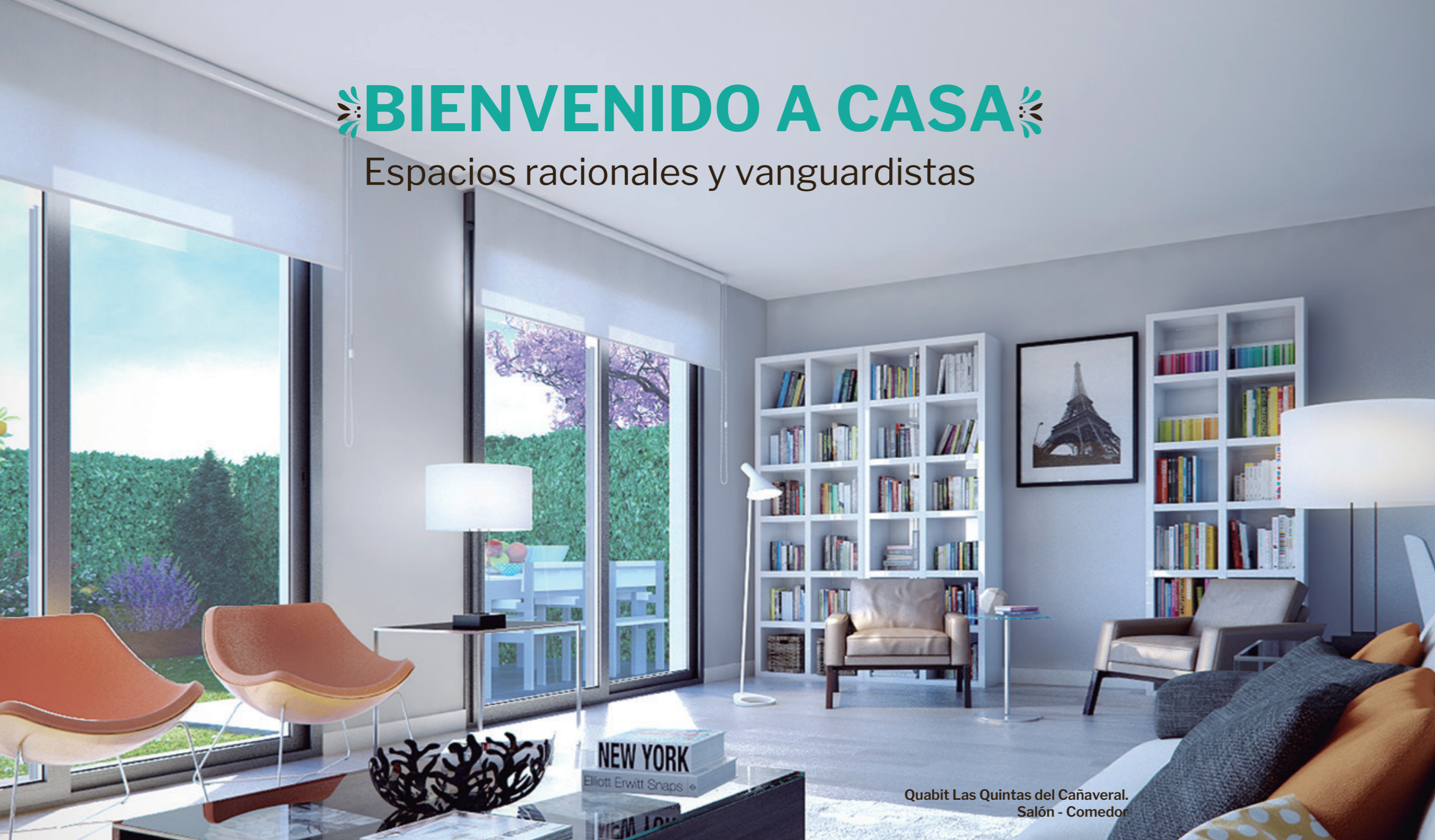
Quabit Las Quintas del Cañaveral. Salón - Comedor

Quabit LAS QUINTAS DEL CAÑAVERAL es un proyecto de referencia con viviendas atractivas y funcionales de 3 y 4 dormitorios, y con unas condiciones de orientación y luminosidad absolutamente estudiadas.