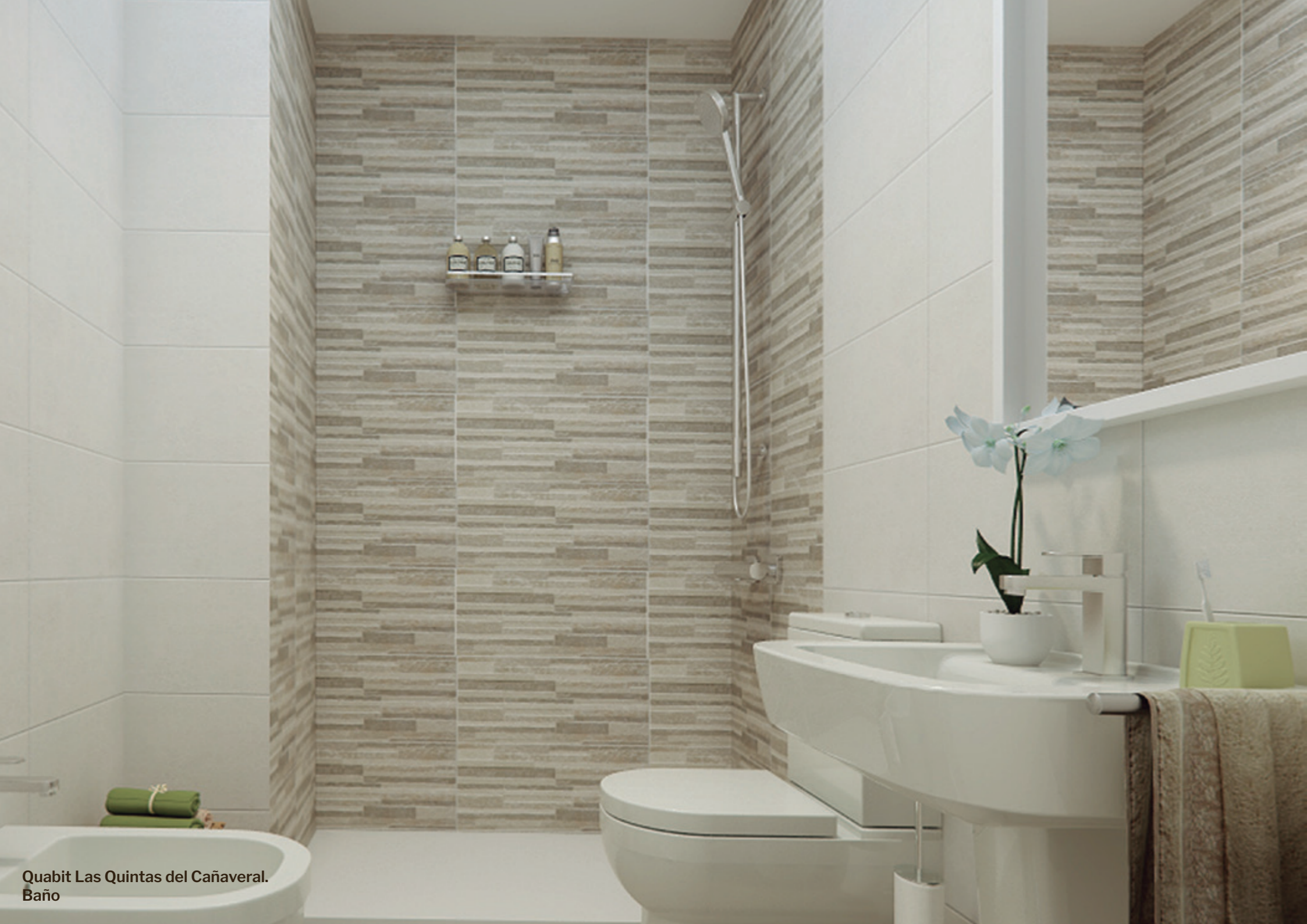
Quabit Las Quintas del Cañaveral. Baño