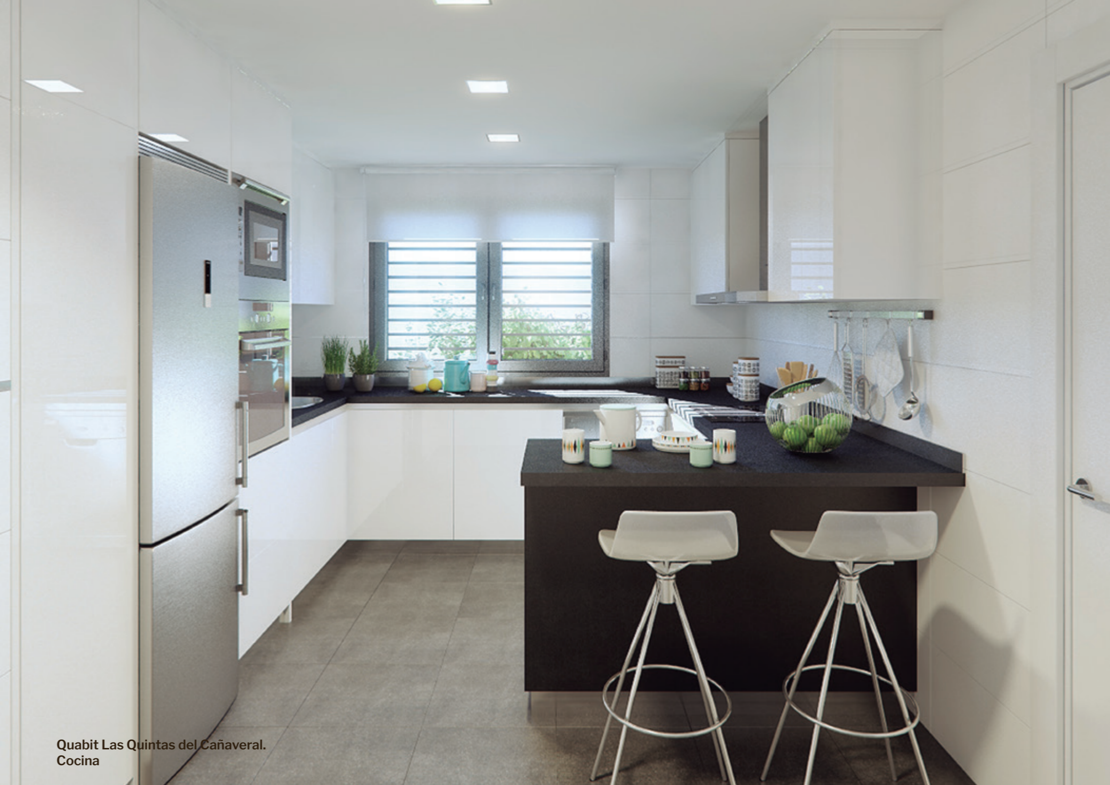
Quabit Las Quintas del Cañaveral. Cocina